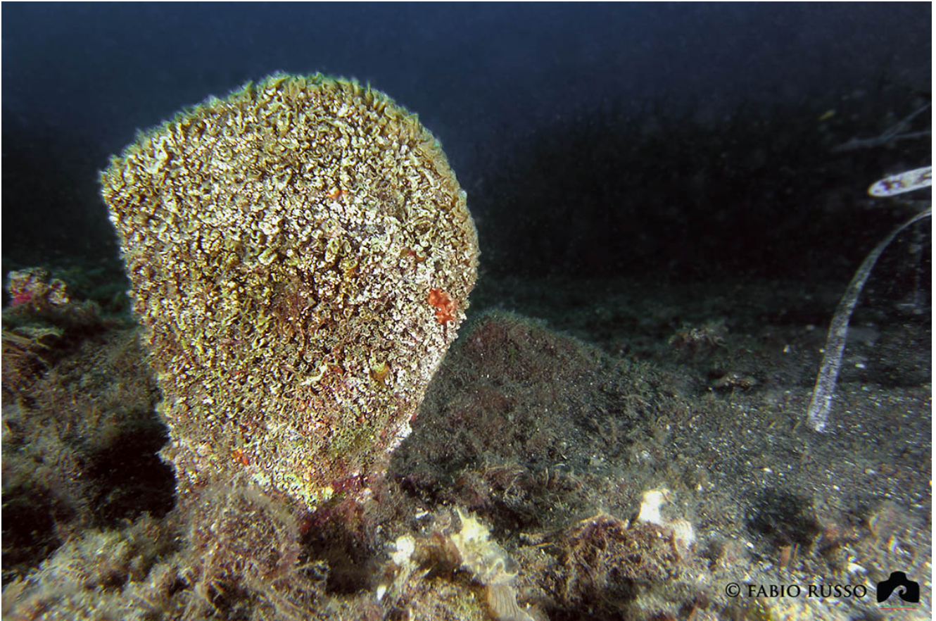
Pinna nobilis

Senza dubbio, ciò che desta più curiosità di questo animale è il ciuffo di filamenti che produce. Il termine bisso, dal greco ἡ βύσσοϛ, indica un tessuto prezioso e raffinato, letteralmente significa lino fino, ed è un termine che compare sin da tempi antichissimi. È citato persino nella Bibbia: nel II libro delle Cronache dell'Antico Testamento, Salomone chiede per la costruzione del tempio che il re di Tiro gli mandi un uomo esperto nei filati di bisso e nella porpora cremisi e violetto; in un altro passo dello stesso libro si descrivono le vesti di bisso dei cantori leviti del tempio. Si dice che Cleopatra si mostrò alla battaglia di Azio (31 a.C.) vestita con velo di bisso, dello stesso materiale erano le tuniche cerimoniali dei sacerdoti d'Egitto e persino il re Davide accompagnò l'Arca dell'Alleanza adornato da una stola di bisso. Ancora, nella Taranto dell'epoca classica erano famose le tarantinidie vesti femminili trasparenti e provocanti dai riflessi dorati, colorazione tipica del bisso marino. In realtà, la letteratura è molto controversa: il termine fu usato per la prima volta per indicare il tessuto derivato dalla penna solo nel 1555, dal naturalista Guillaume Rondelet (1507-1566), e poi lo utilizzò Buonanni nella sua opera sulle conchiglie (1681) distinguendo il bisso marino da quello terrestre. Per questo motivo, il termine bisso nelle autori precedenti al XVI secolo, Aristotele compreso, molto probabilmente non è riferito al filato ricavato