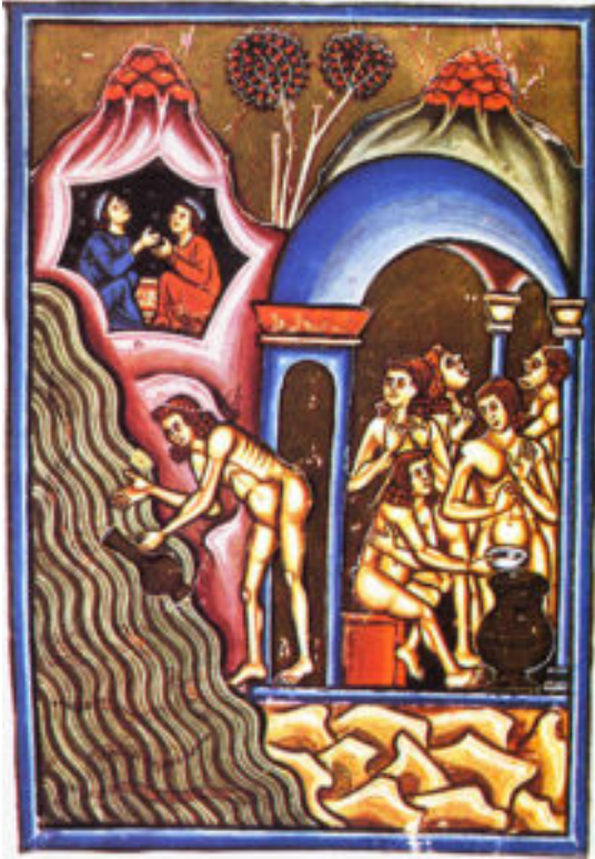
Balneum Sudatorium (Stufe di San Germano).

L'attività di macerazione fu così abolita poiché si pensava fosse responsabile di problemi di salute pubblica. Nel 1861, fu approvato il decreto per il prosciugamento del Lago di Agnano, spostando l'attività di macerazione della canapa alla foce dei Regi Lagni.