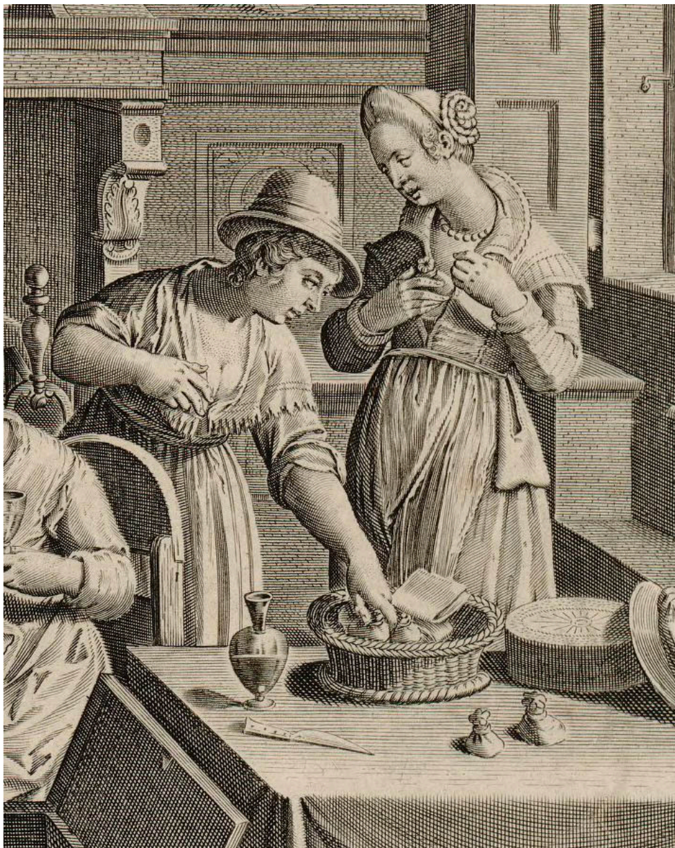
Donne che si collocano tra i seni i bozzoli avvolti in tele di lino (Ian Van der Straet, particolare)

La Sicilia era uno dei centri più fiorenti nella produzione di seta ancora ai tempi di Federico II, arte che fu ben presto trasmessa in Calabria sin dalla prima metà del sec. XI.