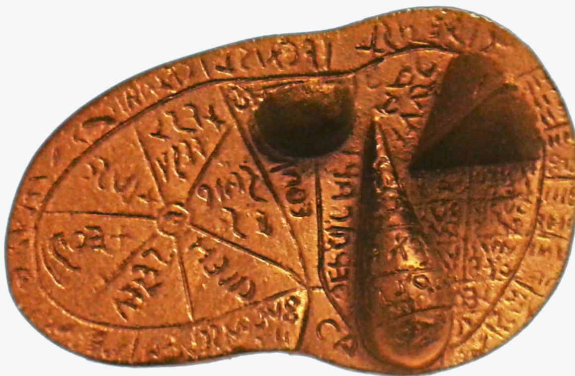
Fegato di Piacenza

abbigliato con ampio mantello e copricapo a punta e sempre con una gamba appoggiata su una roccia, sta esaminando un fegato all'interno di un gruppo di personaggi, uno dei quali è chiamato Tarchunus . È probabile che si tratti dell'iniziazione alla dottrina delle cose occulte di Tarconte, l'eroe eponimo di Tarquinia, da parte di Tagete, profeta al quale è legata la rivelazione della disciplina etrusca.