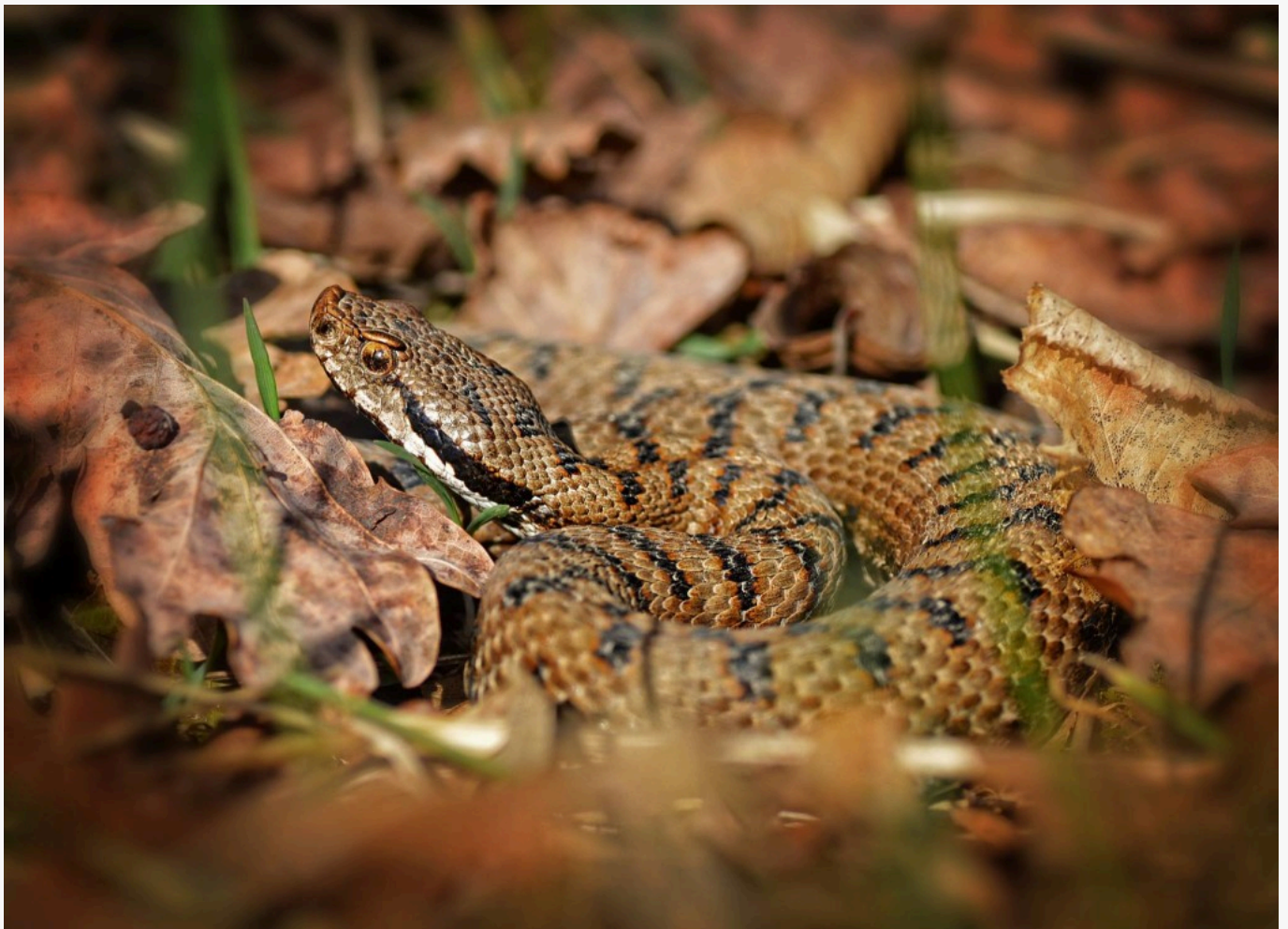
Vipera aspis

volta che si fosse detto di no, io sarei stato il primo ad accettarne le conseguenze, ed a riconoscere giusto il rifiuto del sussidio agli istituti di incoraggiamento di Napoli e Palermo, i quali non sono altro che accademie. [...] ... Ma poiché lo Stato dà lire 28,769 59 all'accademia della Crusca, e ne dà altre 15,709 all'accademia delle scienze di Torino, oltre altre 28,501 89 all'istituto lombardo, io non so perché non dovesse poi dare le 24 mila lire per gl'istituti di incoraggiamento di Napoli e Palermo. Lascio da parte il monopolio della teriaca che è affatto ridicolo, torno a dirlo, il parlarne, e passo a dire che cosa sono gl'istituti d'incoraggiamento di Napoli e di Palermo, se la Camera me lo permette» [Atti del Parlamento Italiano, 1863]; così nella tornata della Camera dei Deputati del 3 febbraio 1863 Federico Capone difese l'Istituto d'Incoraggiamento di Napoli e Palermo.