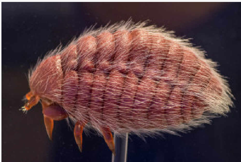
Dactylopius coccus

Grazie a ghiandole diffuse nel corpo dell'animale, la cocciniglia secerne un liquido molto denso e intensamente colorato che usa come involucro per proteggersi dai predatori: in molti casi si tratta di cera pulverulenta o emessa in fili esilissimi reciprocamente intrecciati, in altri la cera secreta si modella in placche o in scudi, in altri ancora la sostanza è una lacca. Questa sostanza raggiunge la massima concentrazione nelle femmine poco prima della deposizione delle uova; in questa fase del ciclo vitale i corpi possono essere schiacciati e resi polvere, così da poter estrarre completamente tutto il colore. L'estrazione si esegue tramite soluzioni acquose contenenti allume di potassio, che permettono di ricavare un colorante che varia dai toni dell'arancio al rosso carminio. Un ettaro di terreno coltivato a cactus produce all'anno circa 300 kg di cocciniglie, equivalenti a 2 kg di colorante (circa 200mila insetti).