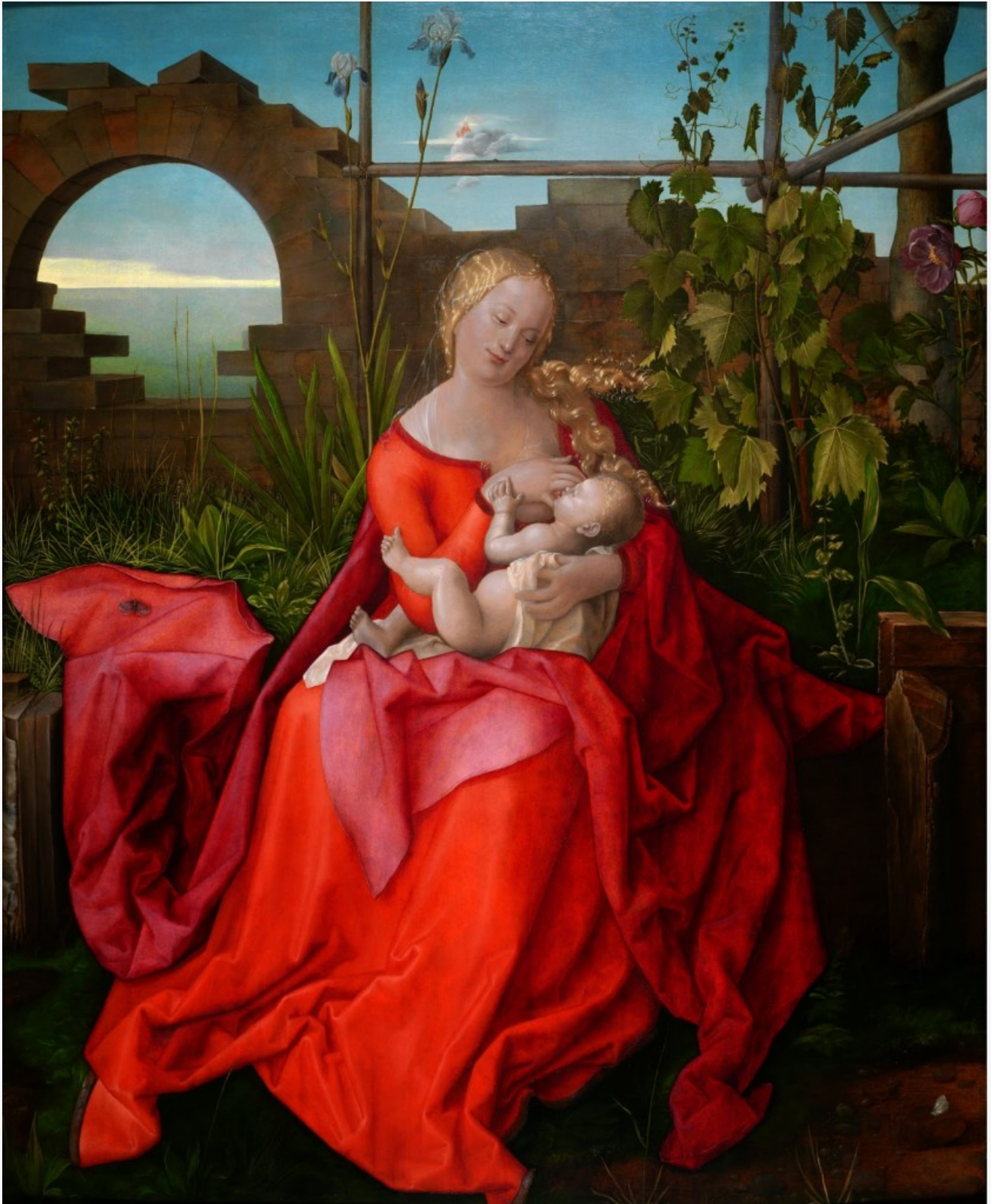
La Madonna con gli iris, dipinto di Albrecht Dürer (1471-1528) presso la National Gallery di Londra.

Il rosso cremisi è anche il colorante usato per l' Alchermes (o Alkermes ), un liquore sciropposo di color rosso rubino composto da alcol, zucchero,