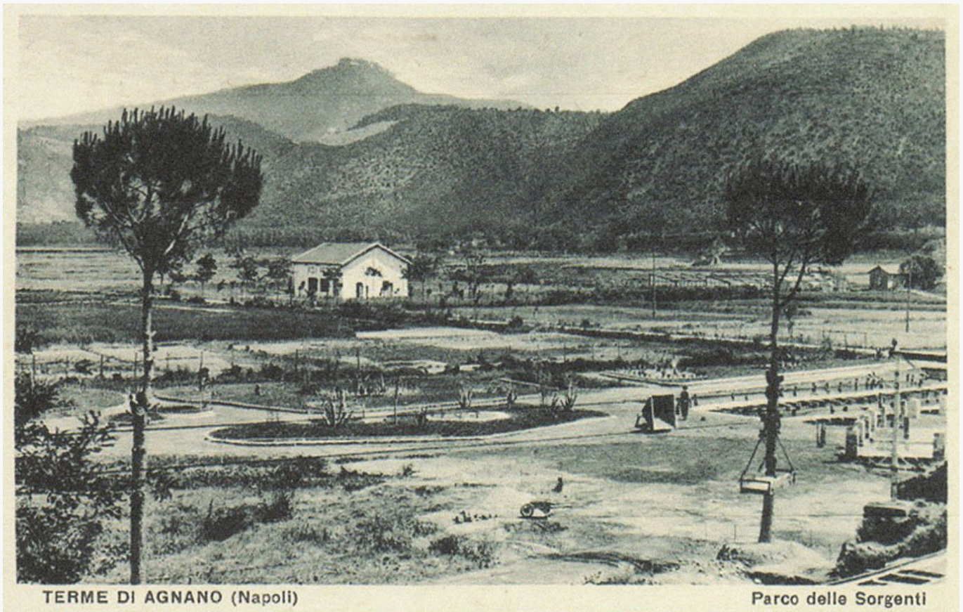
Le terme di Agnano

Oggi le terme di Agnano sono una realtà a beneficio non solo degli abitanti dei Campi Flegrei, ma anche di una moltitudine di turisti, attratti dalla bellezza della struttura e dalla possibilità di fare un tuffo nel passato, ammirando i resti archeologici dei tempi antichi.