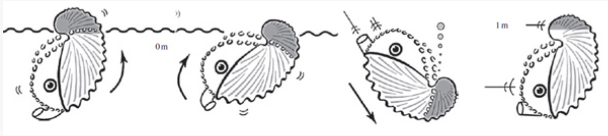
Schema di nuoto della femmina.

Generalmente, infatti, l'argonauta vive in prossimità dei fondali marini tropicali e subtropicali dove si nutre di molluschi pelagici e granchi, catturando le sue prede come un gigantesco anemone marino con le braccia estese. Altro comportamento osservato è il suo spostarsi attaccato a materia galleggiante, quali meduse, salpe, larve di stomatopodi, detriti di piante od altro. Questo adattamento potrebbe consentire all'organismo di muoversi passivamente di notte sulle acque superficiali per deporre le uova e rilasciare le larve.