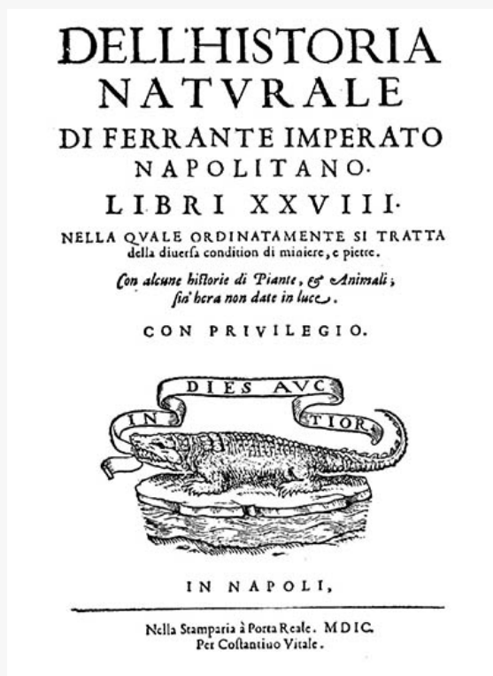
Frontespizio Dell'Historia Naturale

Incerto è il luogo e la data sia della nascita (Napoli, 1550 ca.) sia della morte (Napoli, 1631) ma le sue ricerche, le sue attività e i suoi scritti sono ben noti e non solo ai napoletani. Ignoto il periodo della sua infanzia, probabilmente vissuta a Napoli come il resto della sua vita, ma è conosciuto già speziale e naturalista, uomo affermato nella società per le sue ricerche e il suo lavoro. Sposato e con tre figli, Ferrante ha vissuto in un appartamento sito in via Monteoliveto a Palazzo Gravina (attualmente sede di Architettura dell'Università degli Studi di Napoli "Federico II") al cui interno costruì il suo museo naturale o con nome tedesco Wunderkammer (camera delle meraviglie) tra i più famosi dell'epoca in Europa.