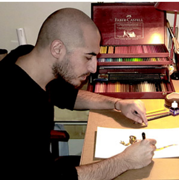
Naturalista – illustratore scientifico