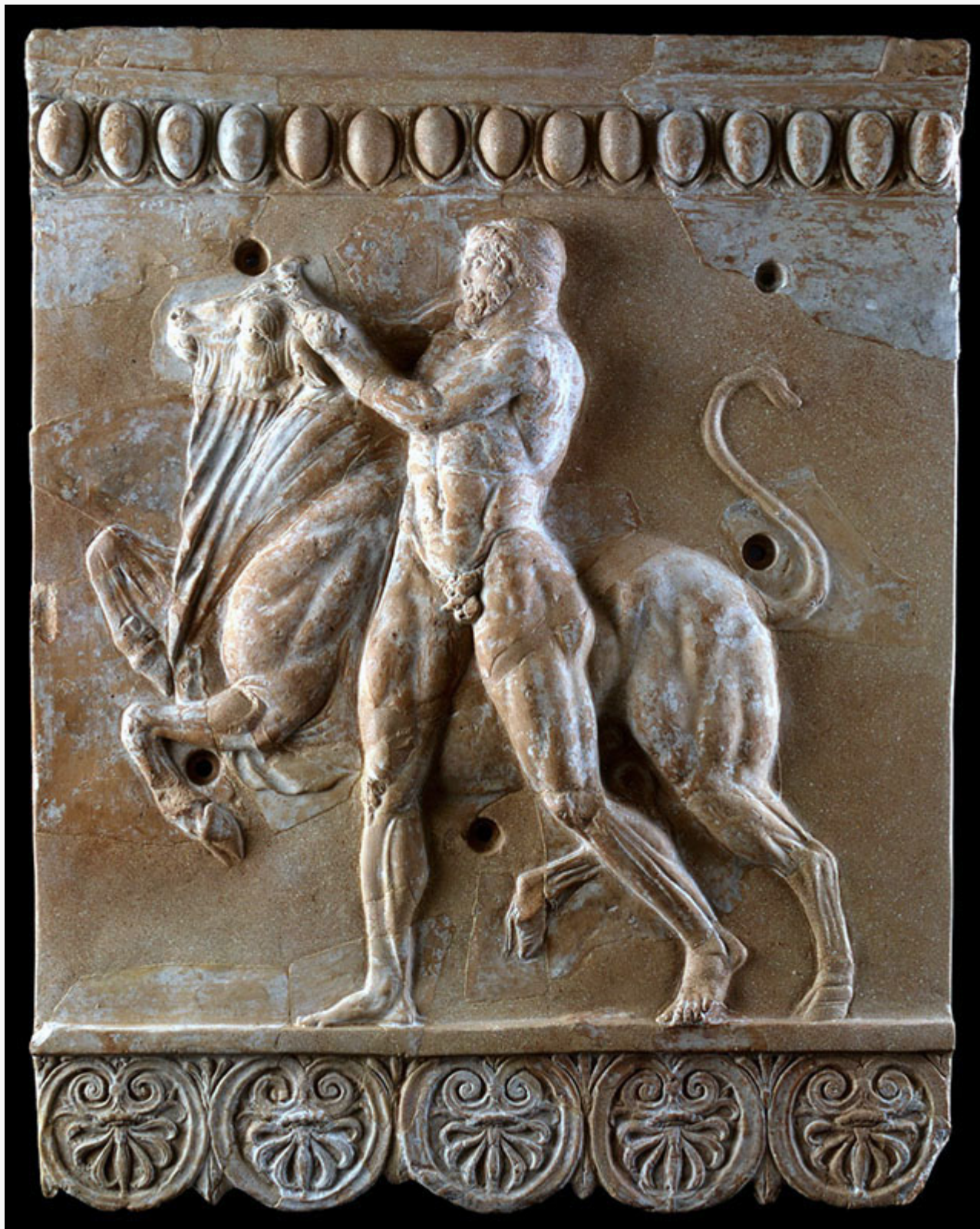
Fatica di Ercole contro il toro (lastra architettonica in terracotta, fine I a.C. prima metà I dC, Musei Vaticani)

Il toro è venerato da innumerevoli popoli, ora come simbolo di forza, ora come simbolo di fecondità. Il suo muggito è associato al tuono tanto che in Asia centrale, Mongolia, Siberia e tra gli Yakuti si crede che vi sia un