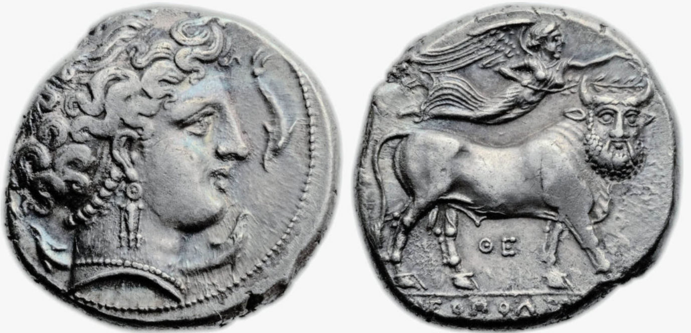
Moneta napoletana raffigurante Partenope e sul verso Ebone (ca. 300 a.C.)

Ebone è raffigurato sul retro di una moneta campana, la zecca di Cales, spesso sovrastato da un astro o in procinto di essere incoronato dalla dea alata Vittoria (Ruotolo, 2010). Questo astro, molto probabilmente il Sole, spinge a riflettere ancor di più sulla possibile identificazione di Ebone con Bacco. Del resto, l'espressione "lucido astro" ( fosfòros astèr ) venne già usata da Aristofane per identificare il Dio dell'ebbrezza. Dunque, è verosimile che il Sole sul dorso del toro androprosopo non sia stato aggiunto come ornamento ma come riferimento manifesto a Bacco.