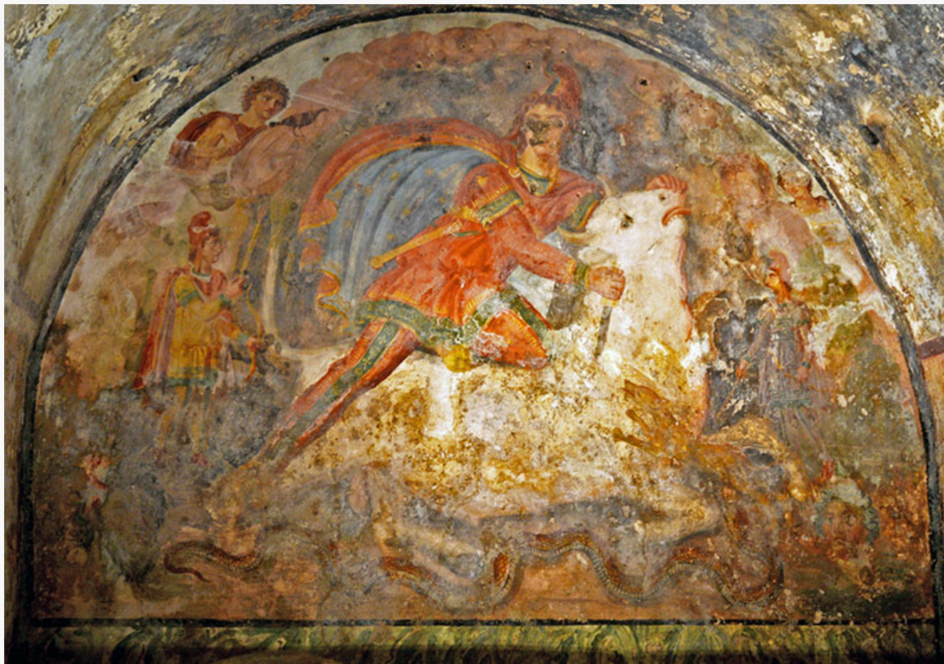
Mitreo di Santa Maria Capua Vetere

Alla luce di questa nuova simbologia, ecco che il toro è portatore di significati apparentemente antitetici, ma in realtà complementari. È un animale lunare poiché legato ai riti della fecondità ed è un animale solare per il suo temperamento focoso. Ricordiamo il Minotauro, nato dall'unione di Pasifae (Luna) con un bellissimo toro e messo a guardia di un labirinto. Ogni otto anni, il re Minosse donava in sacrificio sette fanciulli e sette fanciulle, probabilmente per rinnovare, con il favore di Zeus, il proprio dominio sulla città di Creta. Secondo alcune versioni, questi giovani vergini erano destinati al temibile mostro, secondo altre, erano offerti a Talos, gigante di bronzo posto a guardia della città, a volte descritto con le sembianze di un toro e altre con quelle del sole (Frazer, 1973). Sempre a Creta, attorno alla figura del toro gravita uno sport spettacolare definito taurocatapsia: una sorta di danza acrobatica ricca di capriole eseguite sul dorso di un toro. I giovani cretesi si esibivano nelle arene minoiche in prove di destrezza e abilità fisica misurandosi contro l'indomita bestia. Questa pratica, esercitata nel 3000-1500 a.C. era probabilmente un rituale per omaggiare il possente animale. Ben diversa è