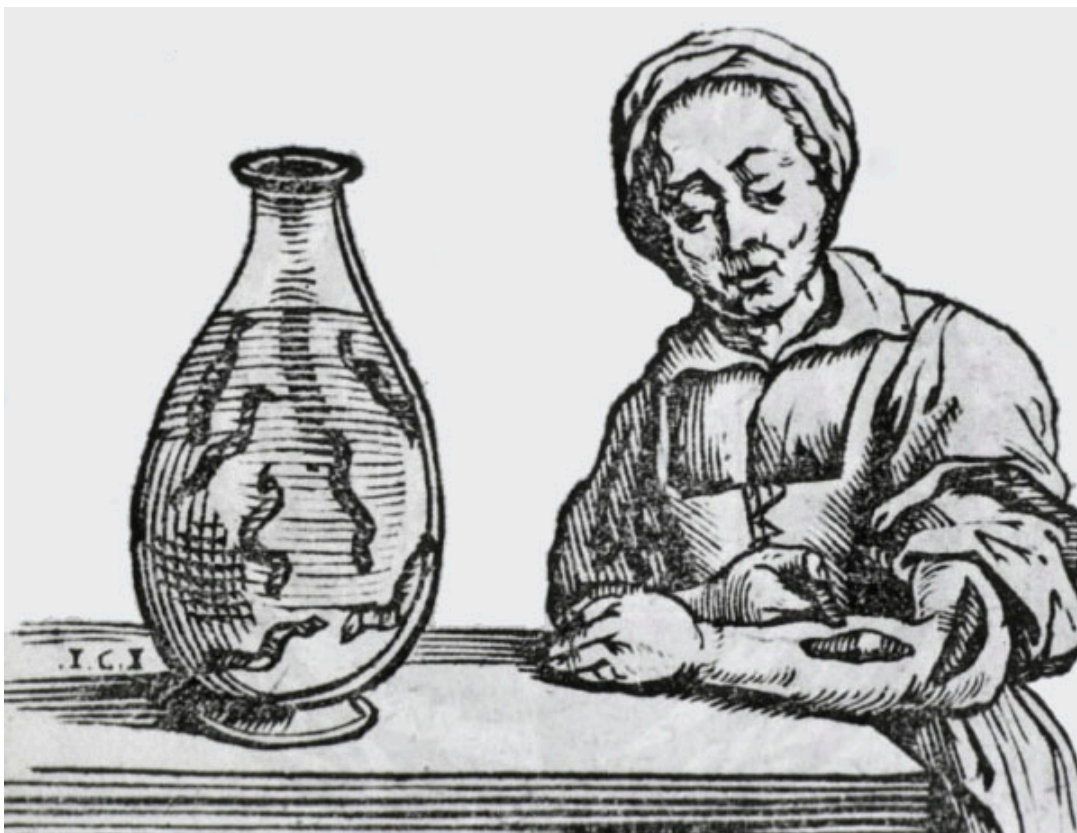
da Historia Medica di Willem van den Bossche (Bruxellae, 1639)

lago d'Averno ed i corsi d'acqua di Vico di Pantano e Mondragone. Gli abitanti di Soccavo, Pianura, Pozzuoli, Bacoli, Aversa, Giuliano, Mondragone, ecc. fanno commercio di sanguisughe nostrali. Nel lago di Agnano, ora prosciugato, scarse erano le sanguisughe e piú abbondanti le emopi. Nella Capitanata è a memorarsi il lago Varano ove si pescano in abbondanza e sono messe in commercio; ed in provincia di Bari, il lago Barsento ove pure sono copiose. In provincia di Lecce abbondano le sanguisughe nei laghi e paludi della Limini fra Otranto e Lecce e principalmente nel lago Fontanelle ove si pescano, non solo coll'entrare dei pescatori a gambe nude nell'acqua e col battere delle pertiche sull'acqua, ma anche raccogliendole mentre aderiscono al ventre dei rospi. In quei luoghi poco abitati sventuratamente la pesca è trascurata e nei paesi limitrofi si preferiscono le sanguisughe provenienti dalla Dalmazia» [Panceri 1875].