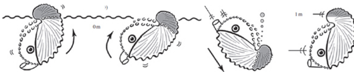
Schema di nuoto della femmina.

rappresenta solo una piccola parte del nuoto dell'argonauta.