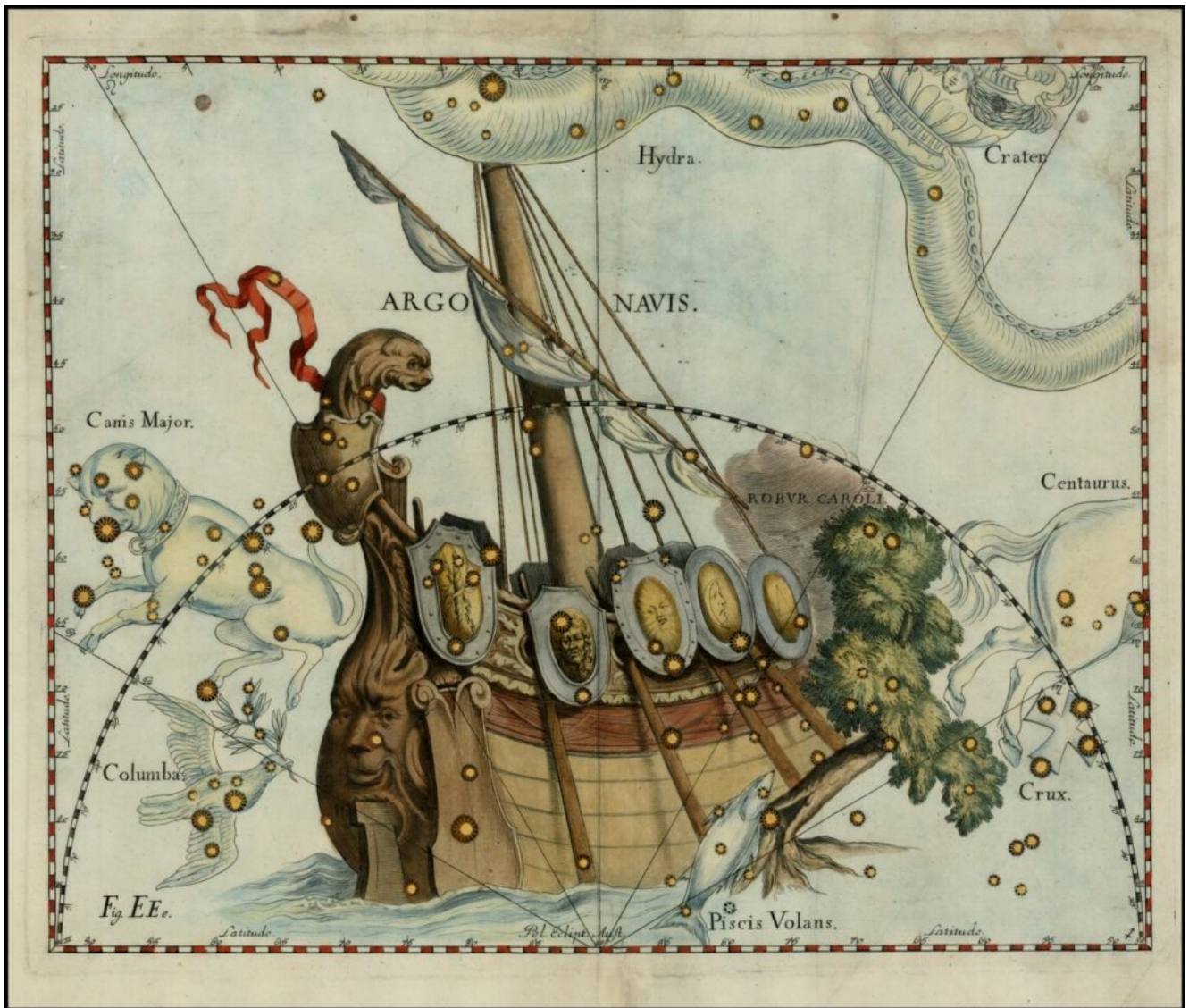
Costellazione Argo navis (tratto da: Johannes Hevelius, Firmamentum Sobiescianum sive Uranographia ).

Già nel 300 a.C. Aristotele descriveva l'argonauta come "un marinaio oceanico in una barca di conchiglia le cui braccia dorsali sono adorne di alte vele per catturare il vento". Non è un caso che uno dei nomi in lingua napoletana di questo animale sia maistrale (Soppelsa, 2016), il vento che spira da Nord-Ovest, e che quindi evocherebbe l'uso delle braccia espanse che l'animale userebbe a mo' di vela; ciò, inoltre, giustificherebbe alcune illustrazioni che ritraggono Argonauta argo mentre galleggia a filo d'acqua con le braccia dorsali espanse protese verso l'alto.